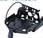
Support chargeur pour véhicule MB-130 A utiliser avec BC-213