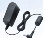
Adaptateur secteur BC-123SE